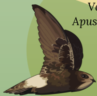
Vencejo Apus unicolor

En el centro se pueden encontrar una gran variedad de especies animales, especialmente insectos, reptiles y aves. Entre las especies presentes se destaca el lagarto gigante de Gran Canaria (especie endémica de la isla)