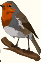
Petirrojo ithacus rubecula rubecula