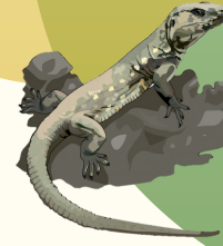
Lagarto gigante de Gran Canaria Gallotia stehlini