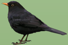
Mirlo Turdus merula Linnaeus