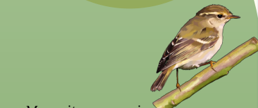
Mosquitero canario Phylloscopus canariensis .