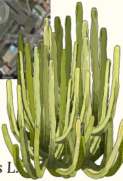
Cardón canario Euphorbia canariensis L.