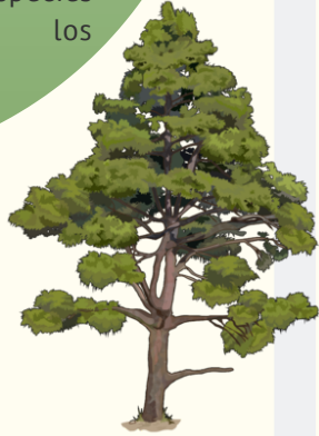
Pino canario Pinus canariensis .

El sendero ambiental cuenta con especies representativas de los pisos de vegetación de Gran Canaria, además de contar con ejemplares de especies exóticas interesantes para los visitantes.